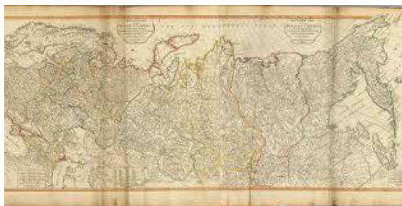
1-rasm. Qadimgi dunyo xaritasi

Odamlar doimo atrofdagi dunyoni anglashga intilganlar. O'tgan davrlar mobaynida xaritalarni yaratishdagi yutuqlar ilmiy va texnik vositalardagi yangi o'zgarishlar bilan chambarchas bog'liq bo'lgan. "Groma" yoki o'Ichovchi xoch - qadimgi Rim yer tuzuvchilari tomonidan to'g'ri mulk chizmalarini chizish va qurilish poydevorlarini belgilash uchun foydalanadigan oddiy ko'rish vositasi - Rim imperiyasining birinchi yo'l xaritalarini ishlab chiqishda foylanilgan.