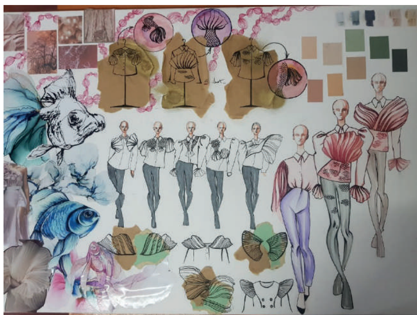
1-rasm. Ijodiy manba va konsepsiya

Ijodiy manbadan foydalangan holda bluzkaning old qismi, yeng, yoqa va bel qismlari “Orando” balig’iga xos ravishda zamonaviy yechimga ega holda eskizlar ishlab chiqildi. Ushbu bluzkaga asosiy urg’u yeng, yoqa va manjetlarga berilgan bo’lib, unda “Orando” balig’ining silueti, tangachalari va mayin tovlanuvchi dumlari aks etgan (1-rasm). Baliq dumlarini bildirish sifatida Organza matosidan va boshqa qismlari uchun Atlas matosidan foydalanildi. Liboslar to’plami ishlab chiqarildi (2-rasm).