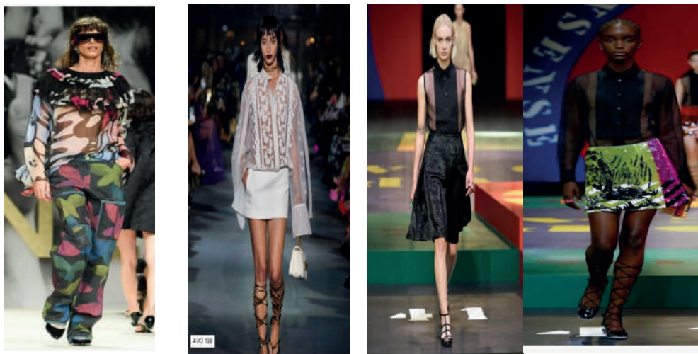
1-rasm. Moda bluzkalari kuz-qish Chanel, Valentino, Christian Dior

pog'onasida bo'ldi va kuzga kelib ham u e'tibordan chetda qolmaydi. Dizaynerlar Christian Dior, Chanel va Valentino nozik matolarni katta bosma naqsh bilan birlashtirib, ushbu zamonaviy bluzkalarni mini yubkalar, pallazo shim va hokazolar bilan kiyishadi.