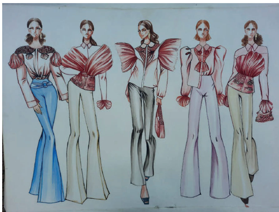
2-rasm. Liboslar to’plami

Ijodiy manbadan foydalangan holda bluzkaning old qismi, yeng, yoqa va bel qismlari “Orando” balig’iga xos ravishda zamonaviy yechimga ega holda eskizlar ishlab chiqildi. Ushbu bluzkaga asosiy urg’u yeng, yoqa va manjetlarga berilgan bo’lib, unda “Orando” balig’ining silueti, tangachalari va mayin tovlanuvchi dumlari aks etgan (1-rasm). Baliq dumlarini bildirish sifatida Organza matosidan va boshqa qismlari uchun Atlas matosidan foydalanildi. Liboslar to’plami ishlab chiqarildi (2-rasm).