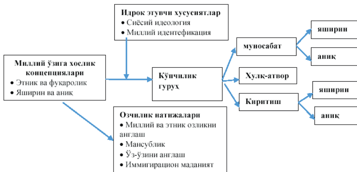
1-расм. Миллий ўзликни англаш концепцияларининг интеграциялашган модели.

Мазкур соҳада халқаро тажрибага асосланиб, шуни хулоса қилиш мумкинки, миллий ўзликни англаш концепцияларининг интеграциялашган моделини ишлаб чиқиш кўп миллатли Ўзбекистонда жамият барқарорлиги таъминлаш омили ҳисобланади (1-расм).