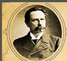
Карл Бенц 1885 год Германия