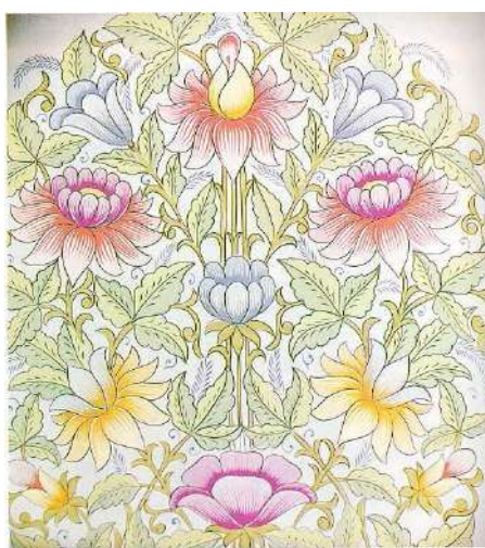
6-расм. Меъморий нақшлардаги гуллар жозибаси

Бу мавзу замонавий меъморлар ижодида ҳам кенг оммалашиб бормоқда, чунончи, Шарқ санъатининг рамзийлик анъанаси ўткинчи бўлмаган қадриятга айланди.(6-расм)