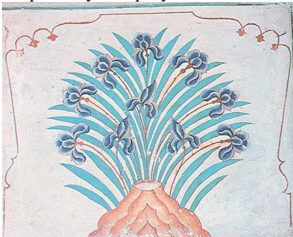
5-расм.Зирк гули. Бухоро XIX аср.

нақш элементи бўлиб, гулларнинг бир тури. У Ўрта Осиё нақшларида жуда кўп учрайди. Бухоро XIX асрда ушбу зирк гули намоянда Ўзига ҳос рамзий маънолар яширинган. Зирк гули- оилага осойишталик ва умрузоқлик рамзи ифодасида ишлатилган. Меҳроб эса икки олам гўзаллигини билдиради. Ўртадаги учта зирк гули оилани яъни ота-она