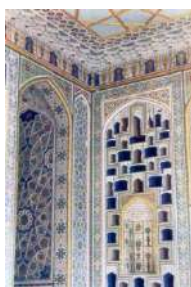
1-расм. Ўзбек миллий интерьер безаклари. Бухоро. Ситораи моҳи -хоса.

Нақш – гул, табиат ва тириклик рамзи. Нақш оламининг рамзий қиёфаси. Нақш Оллоҳ яратган гўзалликнинг бир кўриниши бўлиб, у инсоннинг уйғониш даврида, айниқса, ривож топган ва у мусулмон маданиятининг юксалишида етакчи ўрин эгаллаган. Нақш “оддий безак” даражасидан ислом ғояларини ифода этувчи ўзига ҳос санъатга айланган. Нақш – хотиржамлик, рухий осойишталик, умрузоқлик – чексизликни рамзий ифодалови хилқатдир. Меъморий нақшлар – олий баркамоллик, комиллик, Оллоҳ хузурига йўл олиш рамзлари ҳамдир. Шу тариқа нақш ҳажми гўзалликларни яратган ва уларни бандаларига неъмат қилиб берган ягона ҳукмдир –Оллоҳ хузурига бориш ва унинг жамолига етишиш тамсилдир. Наққошлар ижодида нақш оламининг рамзий қиёфасини акс эттириш ва муайян маънода унинг ғояларини ифодалаш воситасидир. Нақшлар ясама манзара ёхуд бинонинг шунчаки безаги эмас, балки улар Ислום мазмун моҳиятининг, мусулмон киши ҳаётининг, турмуш тарзининг ёрқин ифодасидир. Нақш чодрага ўралган аёлга ўхшайди. Нақш – ҳаққониятни қўл билан ушлаб кўриш эмас, гўзалликни дилда тасдиқлаш, чодра орасидаги ҳолатга ўзини тайёрлаш ва унга кириб бориш тимсолидир.